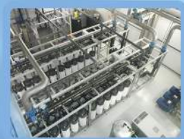
Piscine collective ...