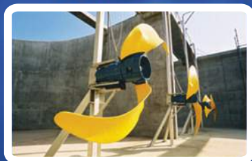
Contrat de maintenance