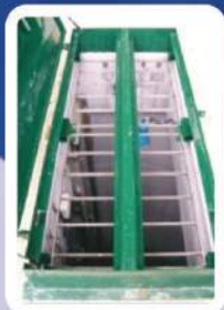
Mise en sécurité