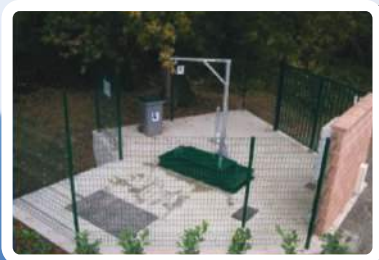
Aménagement et abords

Les postes de refoulement sont un ouvrage important des réseaux.