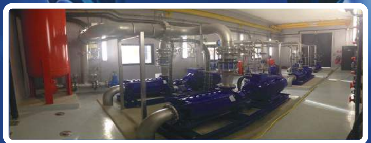
Station de refoulement