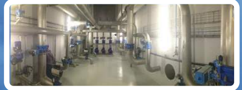
Station de traitement

Pour maîtriser l'exploitation de l'eau, des équipements, nous avons créé différents pôles pour mieux vous satisfaire, comme le Génie Hydraulique qui consiste :